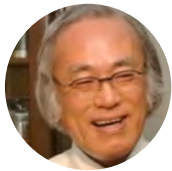
佐藤 優 “人とサイン”