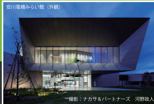
安川電機みらい館 (外観)

そこで「なぜものづくり技術をエンターテイメントで見せたのか」をテーマに、撮影した映像をご覧いただきながら、少しでも具体的な表現に踏み込んでご説明させていただきます。また、多様化する「場づくり」の課題解決のひとつ、乃村工藝社グループが考える「クリエイティブ・エンジニアリング(CE)」という考え方、「情報デザイン×空間デザイン×テクノロジー」が融合した表現による新たな空間体験の価値などについても触れさせていただければと思います。(荻野氏コメント)