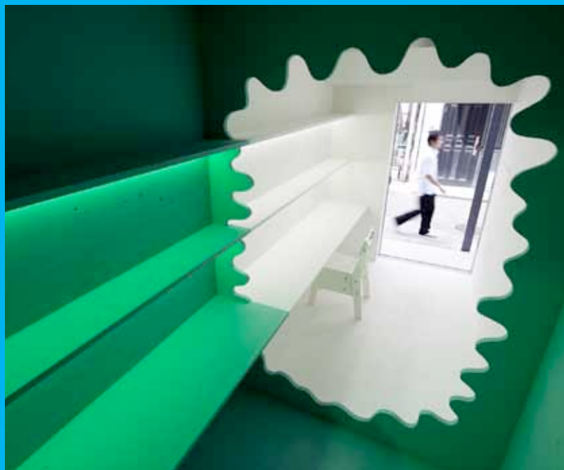
JCDデザイン大賞2011 「レッドライト・ヨコハマ」

当協会のホームページをご覧ください。 http://www.dda.or.jp/