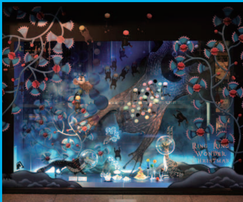
大賞-日本経済新聞社賞 「伊勢丹新宿店本館メンス館「RING RING WONDER CHRISTMAS」