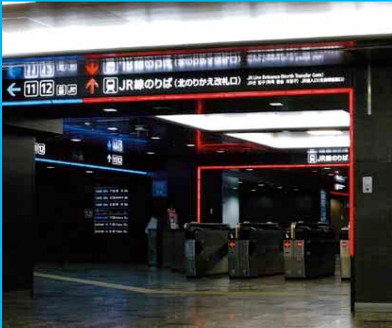
SDA大賞「JR西日本博多駅サイン計画」

JIDは1958年に結成され、半世紀を越え幅広く活動してきた日本を代表するインテリアデザイナーの団体です。その活動は、生活文化の向上と、産業の発展に寄与し、デザインによってより良い環境形成を導き、社会に貢献するところにあります。一昨年は『「終のすみか」を考えるセカンドライフの住い展』を開催しましたが、今年は、少子高齢社会を迎えた日本での子供達を取り上げました。子供達が清く、正しく、のびのびと育つために貢献できるインテリアのスペースとプロダクトの提案・事例を取り上げ「キッズデザイン：スペース&プロダクト展」として全国の会員に呼びかけ、興味ある様々な作品が集まりました。ご覧ください。インテリアデザインにかかわる優れた作品、業績に与えられるJID賞は、隔年開催のピエンナーレ形式で、現在選考中です。来年の展示を期待ください。