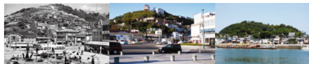
左) 尾道駅前から千光寺眺望(昭和34年ころ) 中) 尾道駅前から千光寺眺望(平成18年ころ) 右) 瀬戸田の景観重点地区

尾道は平安末期に開港した800年の歴史を持つ港湾都市です。歴史ある多くの古刹の丹塗りは古い絵図では町を赤く染めています。鉄道開通により町は山の斜面にまで広がって新しい表情を持つようになり、長い歴史と文化が重なり合った貴重な景観が今に残ります。地方都市としていち早く景観保全活動に取り組んだ尾道の例を紹介し、これからの町の色彩について考えます。