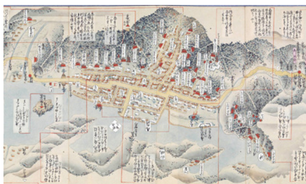
江戸期の尾道の絵地図(中国行程記1706年)

尾道は平安末期に開港した800年の歴史を持つ港湾都市です。歴史ある多くの古刹の丹塗りは古い絵図では町を赤く染めています。鉄道開通により町は山の斜面にまで広がって新しい表情を持つようになり、長い歴史と文化が重なり合った貴重な景観が今に残ります。地方都市としていち早く景観保全活動に取り組んだ尾道の例を紹介し、これからの町の色彩について考えます。